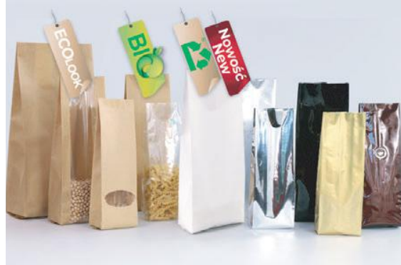
OPAKOWANIA Z FAŁDĄ BOCZNĄ

NOWOŚĆ DOYPACK WINDOW PLUS PRO (+ zaokrąglone rogi + nacinka O + nacięcie laserowe)