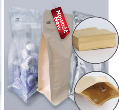
FLAT BOTTOM BOX