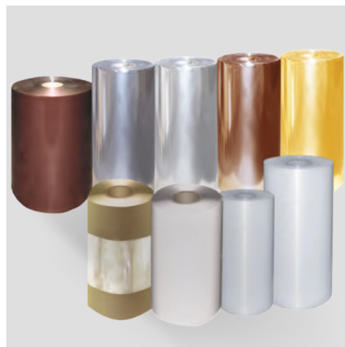
FOLIE I LAMINATY