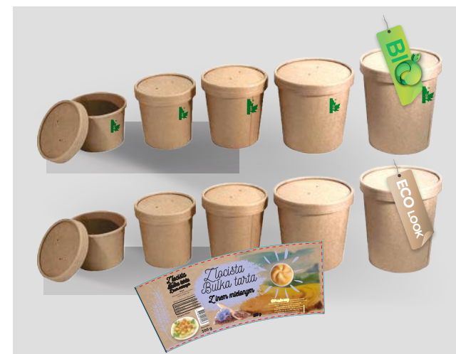
KUBKI + banderole z nadrukiem