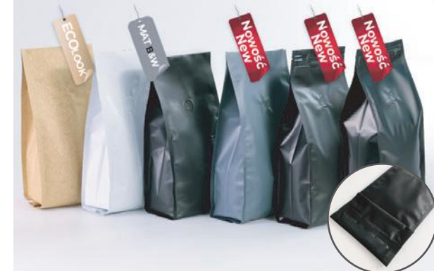
STABILO, STABILO BOTTOM

STABILO ZIP PRO + struna P + nacinka O + nacięcie laserowe + wentyl STABILO ZIP + struna P + nacinka O + nacięcie laserowe + wentyl