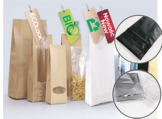
TOREBKI STOJĄCE BOTTOM