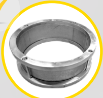
✓ dodatkowe sito z obręczą