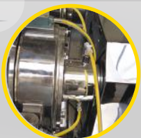
✓ płaszcz wodny