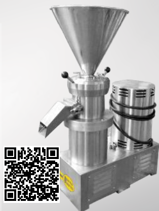
Młyn koloidalny MK/S 500