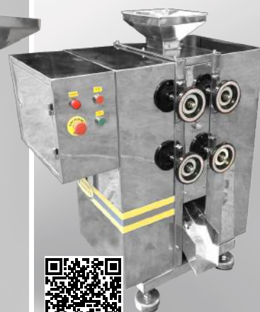
Młyn walcowy MWCS/S 100/2