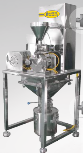
Młyn drobniący MFCS/S 50 DC