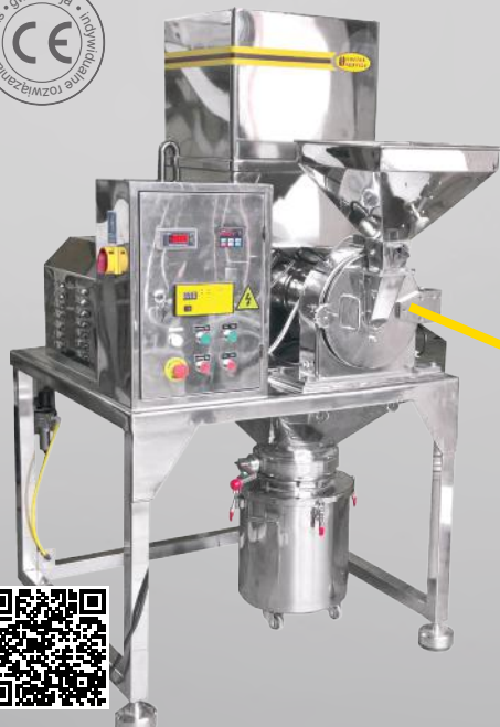
Młyn uniwersalny MUCS/S 150 DC (ze stacją filtrującą DC)