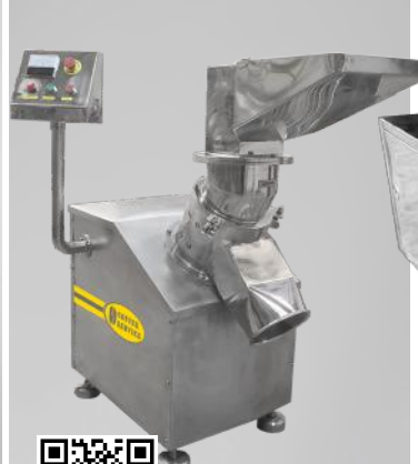
Rozdrabniacz uniwersalny RU/S 300