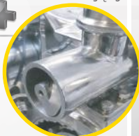
✓ ślimak podający