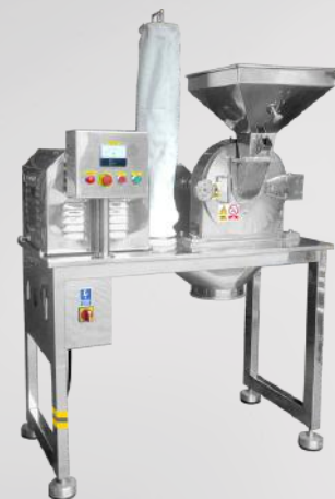
Młyn uniwersalny MUCS/S 300