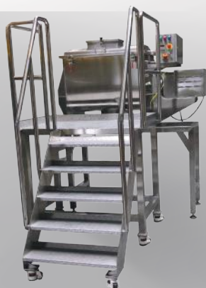
Mieszarka pozioma MPCS/S 200 + podest ze schodami P 200