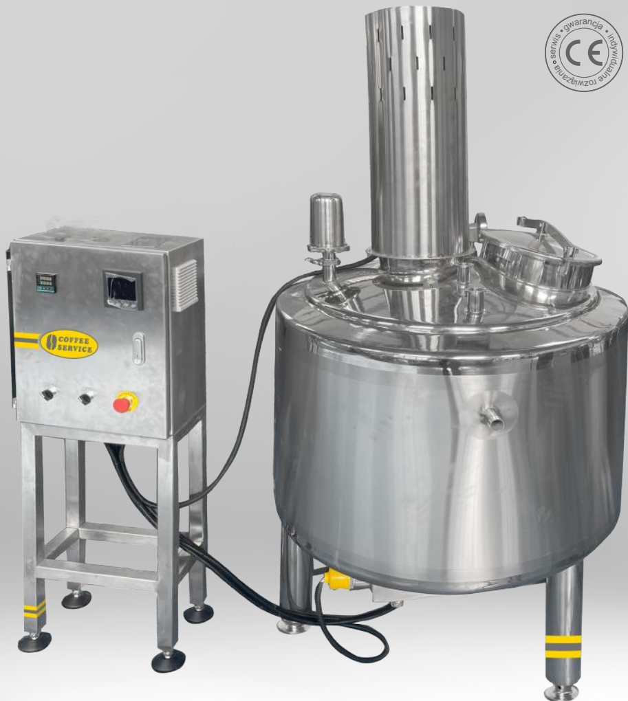
Mieszarka pionowa MPP/S 300 HOT