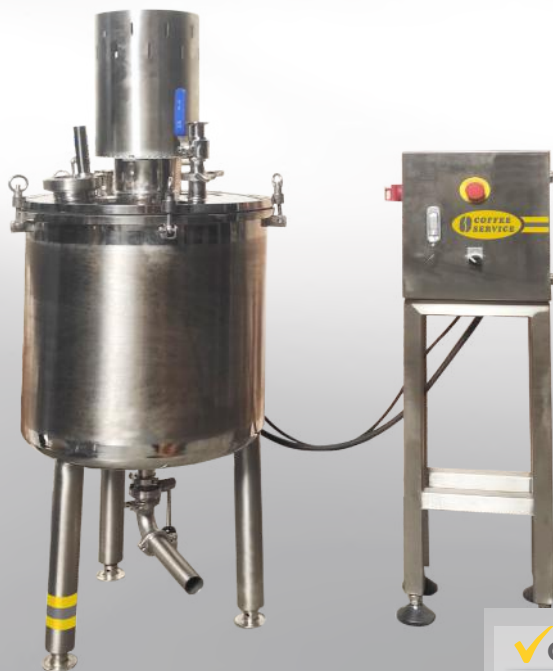
Mieszarka pionowa MPP/S 100