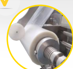
membrana z folii na rolce