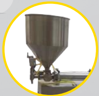
dozownik płynów gęstych