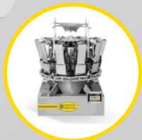
dozownik wagowy kombinacyjny