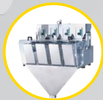
dozownik wagowy liniowy