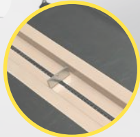
popychacze z łańcuchem