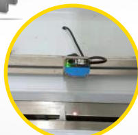
blokowanie pustych przelotów