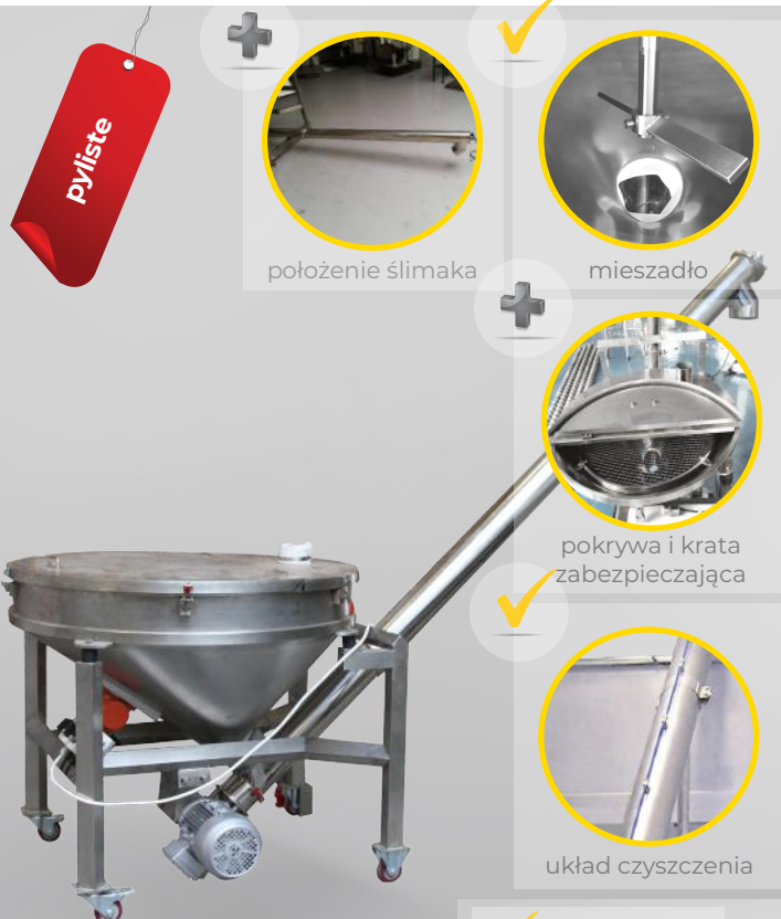
Podajnik ślimakowy PSM/S 2000