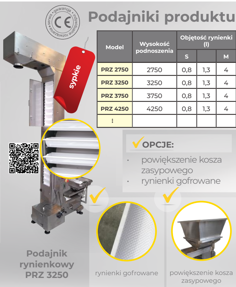
Podajnik rybieniowy PRZ 3250