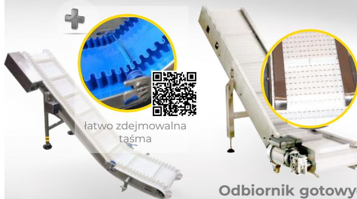
Odbiornik gotowych torebek OGTL/S 300