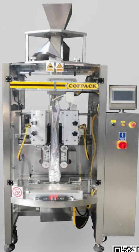
COFPACK P/S 50/430 STABILO