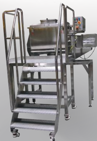
Mieszarka pozioma MPCS/S 200 + podest