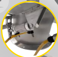
zawór wysypowy pneumatyczny