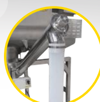
przełożnik ślimakowy skośny