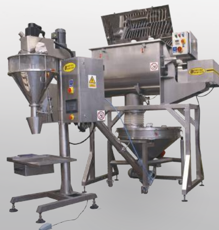
Linia mieszająca: Mieszarka pozioma MPC/S 300 + dozownik wolnostojący ślimakowy DWS/S 3000 + podajnik ślimakowy PSM/S 2000