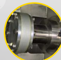
pneumatyczne uszczelnianie wału