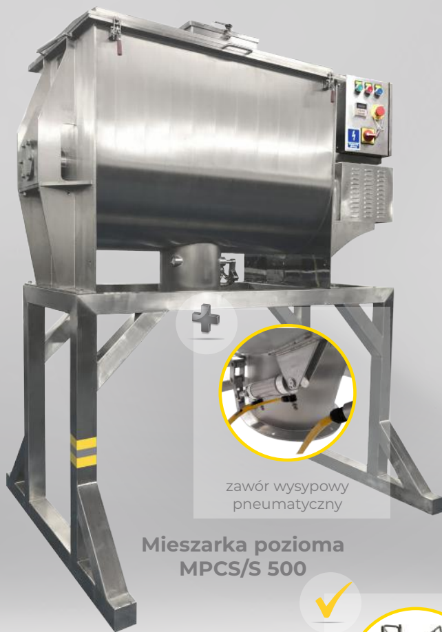
Mieszarka pozioma MPCS/S 500