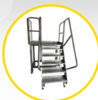
podest ze schodami