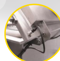
czujnik otwarcia pokrywy