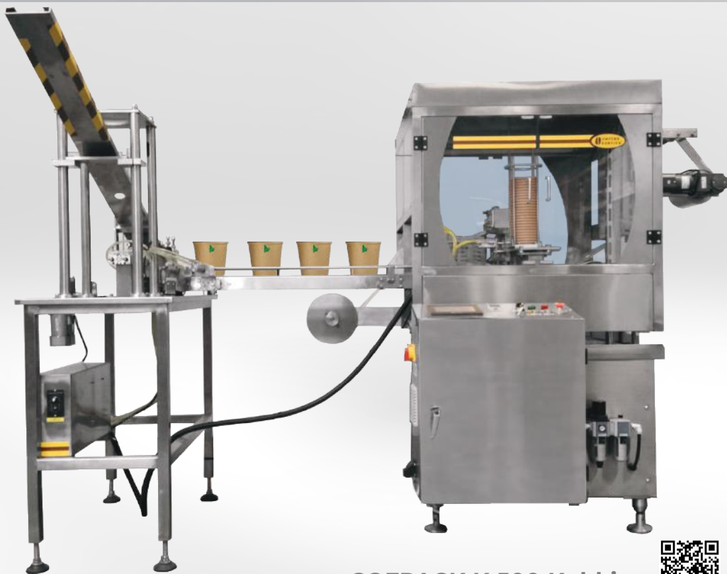
COFPACK K 500 Kubki