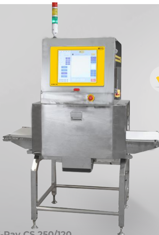
X-Ray CS 250/120