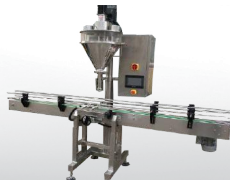
Linia do pakowania w puszkę LPP/S 500 A