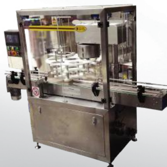
Automatyczna zamykarka puszek/tub AZP/S 30