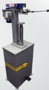
Półautomatyczna zamykarka puszek/tub ZPP