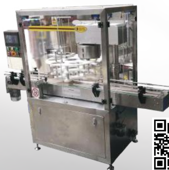
Automatyczna zamykarka puszek/tub AZP/S 30