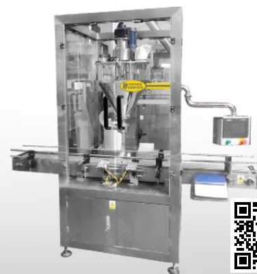
Stacja dozująca do proszków SDP/S 3000 A