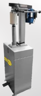
Półautomatyczna zamykarka puszek/tub ZPP